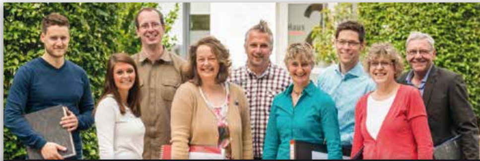
GIS-Team der Berthold Becker GmbH